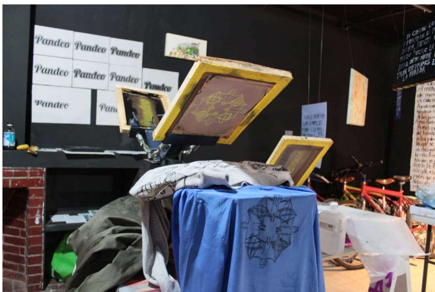
Impresión multitudinaria, de Sara Tovar Fotografía digital

Esta exposición se basó en nuestras propuestas individuales que reflejan experiencias de lo que nos significa vivir en la Ciudad de México; en torno se realizaron talleres, conversatorios y convocatorias desde una perspectiva crítica y reflexiva de cómo se mueven nuestros cuerpos, dónde viven y cómo nos confronta un contexto que intenta individualizarnos y aislarnos.